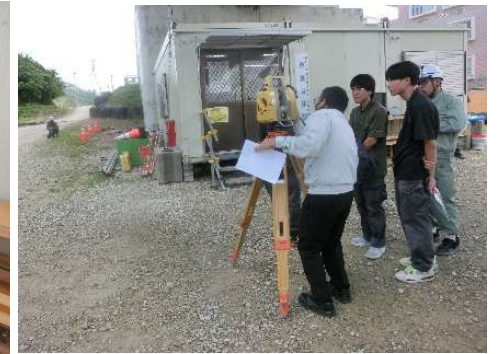
國幸興發株式会社による最新測量技術講習